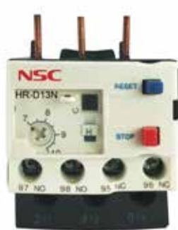
Thermal Overload Relay