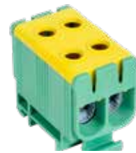
FJ-E50/2/D (Without earthing feet)