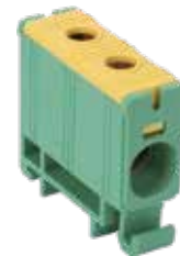
FJ-E35/D (Without earthing feet)