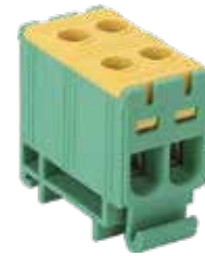
FJ-E16/2/D (Without earthing feet)