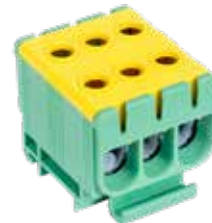
FJ-E50/3/D (Without earthing feet)