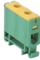
FJ-E16/D (Without earthing feet)